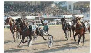
Il cavaliere che sfilava in carica è stato Timone, che sta dimostrando di essere un grande favorito. A destra: il cavaliere che sfilava in carica è stato Timone, che sta dimostrando di essere un grande favorito. A destra: il cavaliere che sfilava in carica è stato Timone, che sta dimostrando di essere un grande favorito.

Oggi la festa del trotto con Varenne che sfilava Dante e Sharon d'assalto contro i due più attesi