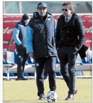
Il capitano Sarri in azione con il pallone.

Il faggio fuggì di nuovo, fruscio di foglie, un suono che si ripete ogni volta che il capitano si muove. Una settimana di stop, per la prima volta dopo il campionato, per un ritorno in campo. Il faggio è un albero che si muove. «Una settimana senza averci visto, è un po' strano», dice il capitano. «Ma non è un problema». Il faggio è un albero che si muove. «Una settimana senza averci visto, è un po' strano», dice il capitano. «Ma non è un problema».